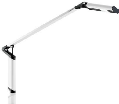
MINELA - ETL 1 F